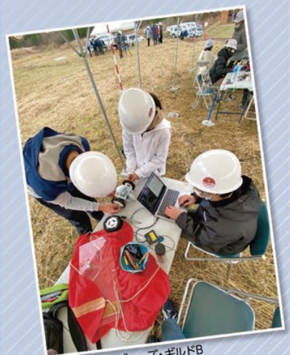
④UTチャレンジャーズ・ギルドB