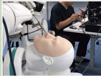
②ロボティック医療システム