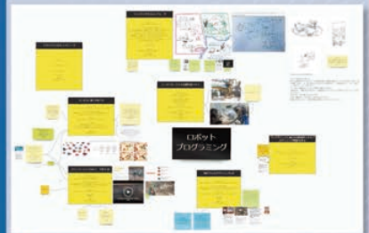
③スタートアップ・トレーニング(駒場)