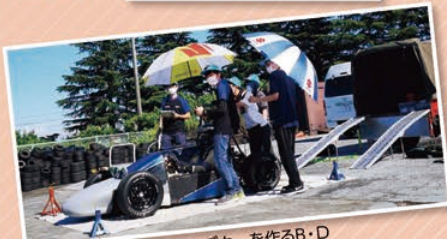
④⑤フォーミュラレーシングカーを作るB・D