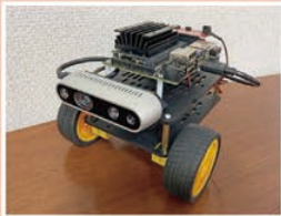
③知能化自動車開発入門