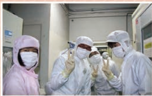
⑧ナノ・バイオテクノロジー:最先端ラボへようこそ