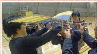
⑩飛行ロボットを作って飛ばす