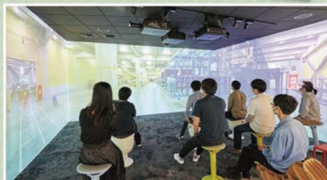
⑩新モビリティから考えるスマートシティ:技術・政策・ビジネスの実践に向けて